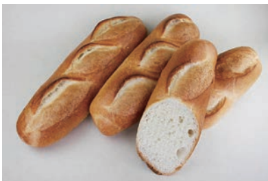
成形冷凍フランスパン(大) (発酵種併用による風味・食感の改善)