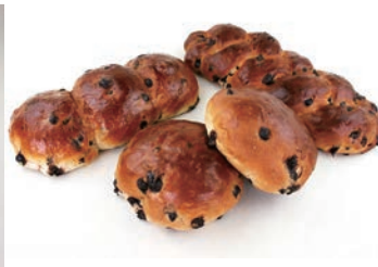
生地玉冷凍チョコブレッド