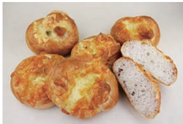
生地玉冷凍ポテトブレッド