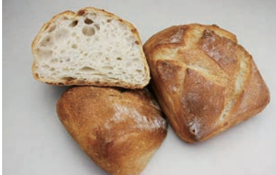
パーベイク リュスティック (フルベイク)