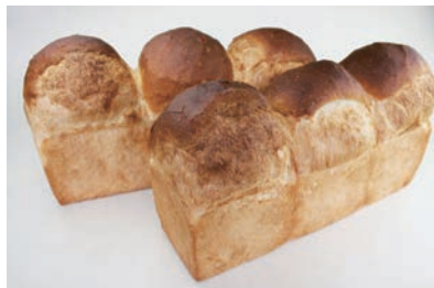
生地玉冷凍によるイギリスパン (発酵種併用による風味・食感の改善)