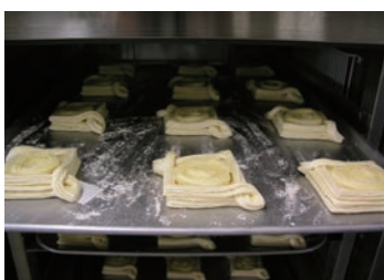
急速冷凍中のホイロ後冷凍デニッシュ ホイロ出し率は約80%で急速冷凍