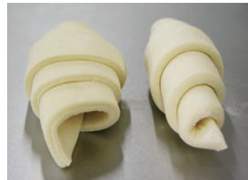
ホイロ後冷凍クロワッサン 成型方法と最終形状の比較 および改良剤スペックの違い