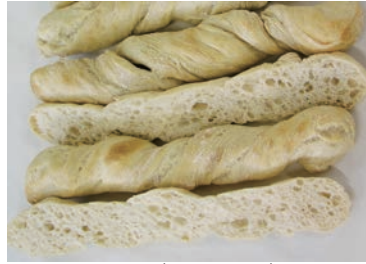
パーベイク プルツェルブロート 多加水 食事パンのパーベイクによる合理提供