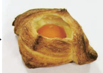
ホイロ後冷凍デニッシュ (冷凍保管約100日後)