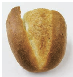
成形冷凍生地フランスパン(中) 左:パイルの上がり 右:内相の状態