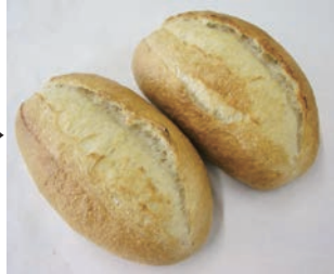
ホイロ後冷凍ヴァイツェンブロート