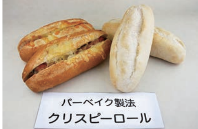
パーベイク製法 クリスピーロール