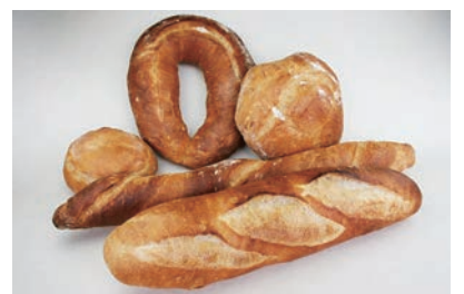
生地玉冷凍生地フランスパン(大) (発酵種併用による風味・食感の改善)