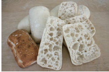
パーベイク チャバッタ