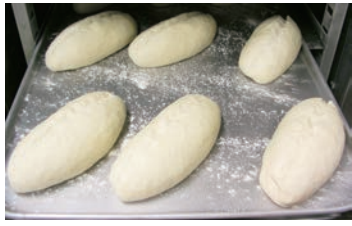
冷却過程のホイロ後冷凍生地 (ヴァイツェンブロート)