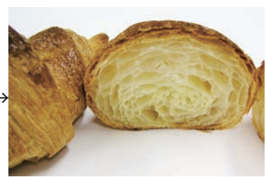
ホイロ後冷凍クロワッサン (冷凍保管約90日後)

お問い合わせ等は 03 - 3689 - 7571 日本パン技術研究所 伊賀まで