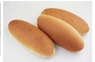
フラワーブルー法 成形冷凍焼き調理パン