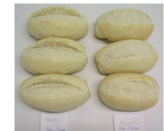
パーベイククリスピーロールの 成形条件の違いと最終形状